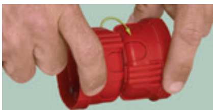
2 x 0 801 08 (jumelées dos à dos)