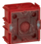
0 801 41 + 0 801 99