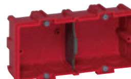
0 801 42