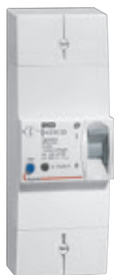
4 010 03