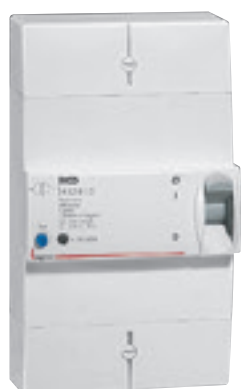
4 010 13

Disjoncteurs d'abonné Basse Tension BACO pour tarif à puissance limitée (tarif bleu) de 3 à 36 kVA :