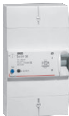
4 011 38